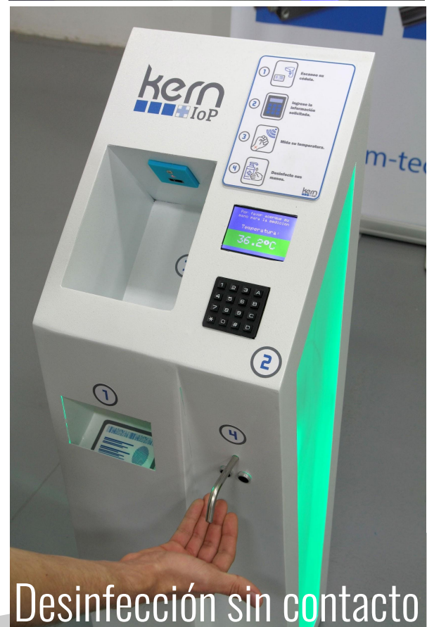
Desinfección sin contacto