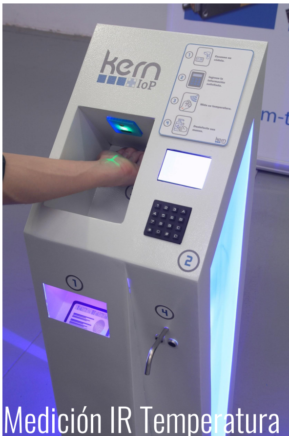
Medición IR Temperatura