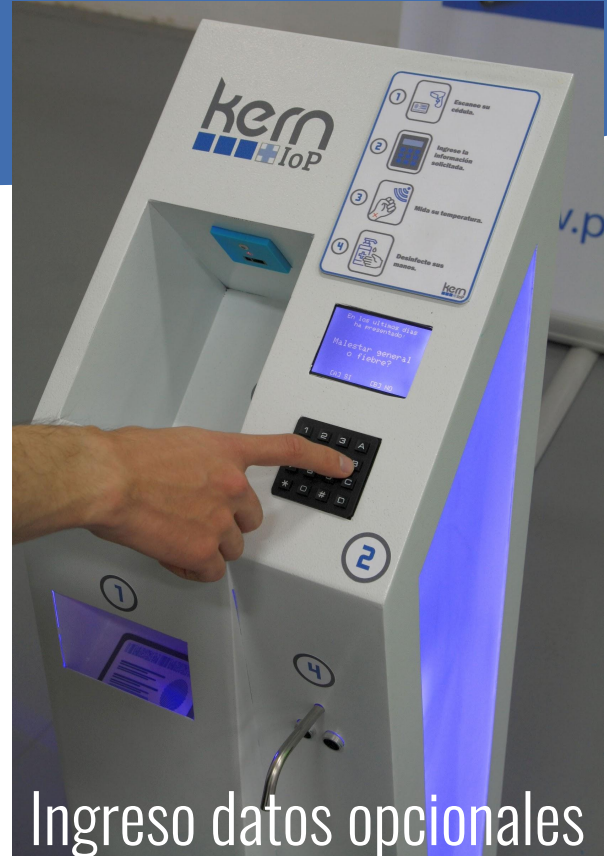
Ingreso datos opcionales