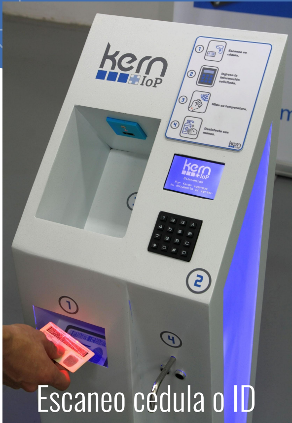
Escaneo cédula o ID